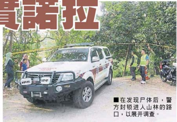
在发现尸体后，警方封锁进入山林的路口，以展开调查。