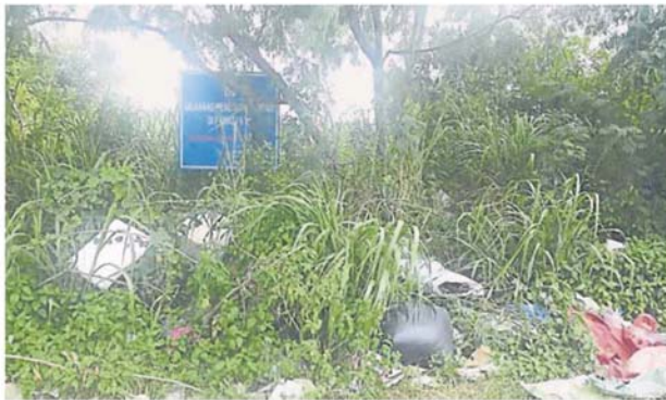
加影市议会置放的禁止丢垃圾告示牌形同虚设。