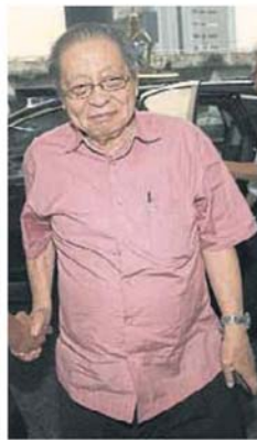
■林吉祥出席行动党莱纳斯汇报会。