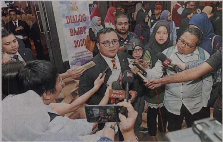
■阿米鲁丁说，州政府于今年重新调整健康关怀计划门槛后，确实有蛮多批准者遭到取消资格。

(沙亚南13日讯)雪州大臣阿米鲁丁披露，州政府于今年重新调整健康关怀计划门槛后，确实有蛮多批准者遭到取消资格，主要是一些受惠者获批准后，一直都没有领取健康关怀卡，还有一些则是因为收入不符合标准而遭到取消。