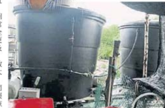
■岛民感叹若不是有类似大水槽“救命”, 肯定难以应付今次庞大的游客量, 岛民一早就没水用了。