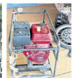
■一些业者和岛民自备小型发电机, 可以应付短暂的断电问题。