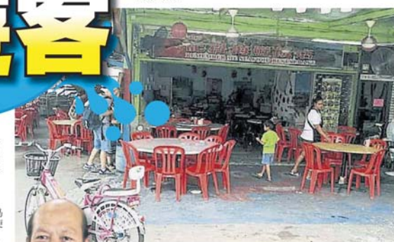
■一旦断电, 餐馆内便是一片漆黑, 难以正常做生意。

针对该岛频频断水的问题, 水供公司也采取应对措施, 除了马上维修破裂水管外, 也设法增加该岛的水压, 让该岛供水及时恢复正常, 该公司也会严密监督该岛供水, 避免一再为岛民带来困扰。