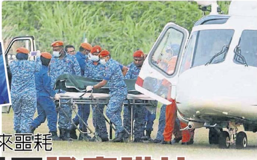
警方出动直升机运载尸体。