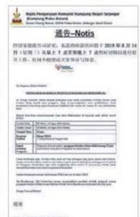
■乡管会转发国能文告, 提醒岛民该岛将于明天断电12个小时。

根据国能文告, 吉胆岛和五条港将于周三(14日)早上7时至晚上7时, 中断供电12个小时, 以便为巴士生港口地区主要变电站进行提升工程, 届时该岛两个渔村, 预料约1500名用户, 受到影响。