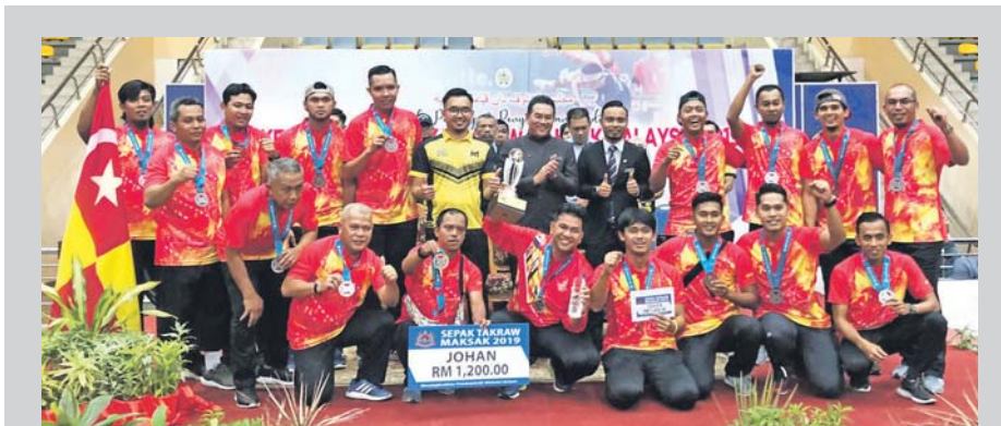
Kem takraw MAKSAK Selangor meraikan kejayaan menjuarai sepak takraw MAKSAK Kebangsaan 2019 di Stadium Negeri, Kuala Terengganu, baru-baru ini.