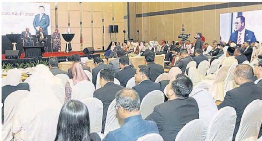
■展席。雪州2020年财政预算案论坛时，吸引逾百人士出席。雪州政府所举办第2场「朝向健康文化发