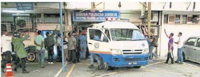
送抵医院太平间。死者遗体由民防部队救护车。