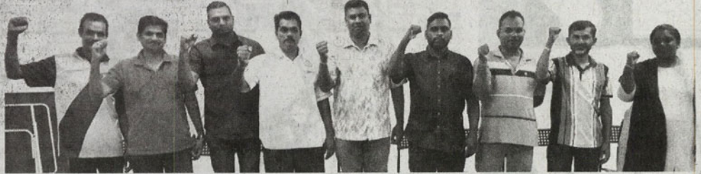
எதிர்ப்பு தெரிவிக்கும் உலுசிலாங்கூர் பெ.ஆ.சங்கத் தலைவர்கள்.

உலுசிலாங்கூர் பெ.ஆ.சங்கத் தலைவர்கள் கோரிக்கை